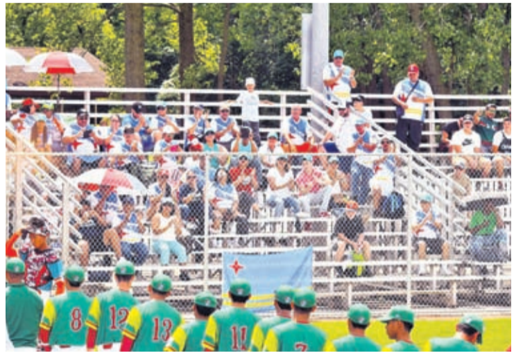
ekipo di Chinese Taipei cu ta na Taylor, Michigan. e campeon e ultimo 5 aña aki